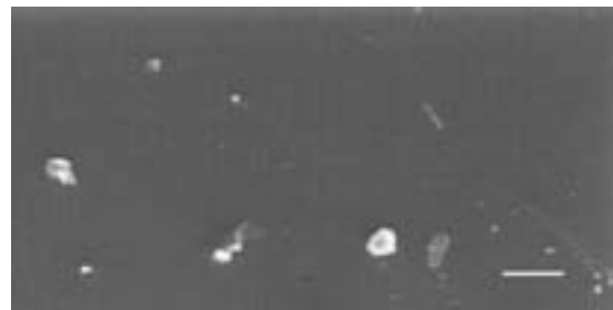
図1 粉塵の拡大観察 (SE 像, bar: 10 \mu\text{m} )