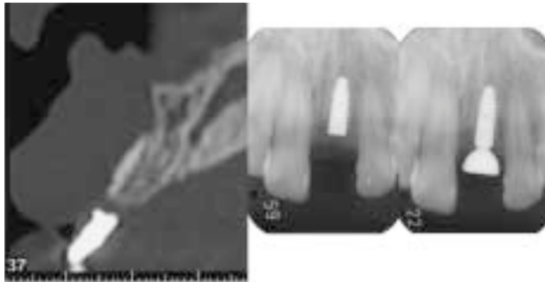
図 3 Ankylos インプラントを上顎前歯部に適用した症例。骨幅が不足していたために、頬側に骨移植してある。海綿骨量は充分であり、深い埋入によって初期固定が損なわれることはないと判断した。

表面は Gridblast と酸処理による粗面である。フィクスチャーとアバットメントは 6° のテーパ-接合によって固定され、フィクスチャーの上面の直径に対してアバットメントの頸部の直径が小さく、いわゆる platform switching のコンセプトが最大の特徴である。現在ではフィクスチャーの上面はすべて粗面となっており、顎骨頂部より約 1.5mm 深く埋入することにより、フィクスチャー上面の辺縁部に骨が形成され、周囲軟組織のマネージメントが非常にしやすいこと、隣接する天然歯との関係に余裕があることなど、利点が多い。とくに前歯部などの審美領域では、インプラント周囲の軟組織の安定が重要で、本システムの優位性が強調される。また、2 回法のインプラントの中でも、深い埋入により、治癒期間の義歯装着にとって有利である。図 3 は本システムを上顎前歯部に適用した症例である。海綿骨の量は充分にあり、骨頂部より約 1.5mm 深く埋入することによって、唇側歯肉の形態が保たれやすいことから、他のシステムに比較して長期の予後が期待できると考えられる。