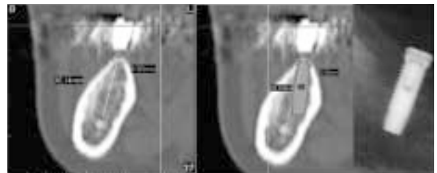
図 1 Brånemark システムのインプラントを適用した症例。下顎骨の高さ、幅共に充分であるが、頂部の緻密骨が薄く、この部分での初期固定はあまり期待できない。

表面は Brånemark システムと同じく TiUnite である。フィクスチャーとアパットメントの接合が三角形の嵌合部によって規定されることが大きな特徴で、このため補綴物の装着が容易であるという利点がある。システムも比較的単純で術者にとっては扱いやすいシステムであるといえる。しかしながら、接合部の三角形の頂点が頰側に向いていなければならないために、微妙な埋入深度の調整に苦慮することもある。選択基準は Brånemark シ