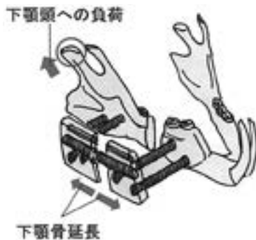
図1：下顎骨延長術の模式図。下顎骨延長を施すことで下顎頭に異常な負荷をかけた。

顎変形症患者に対する外科的矯正手術の術後の偶発症・合併症の一つとして、Progressive Condylar Resorption (PCR) をはじめとした異常な下顎頭吸収の発症がしばしば認められる。Sakagami ら (2014) はラットの下顎骨延長を施し下顎頭を後上方移動させることで、下顎頭に異常な力学的負荷を与える実験を行った。その実験より得られた、下顎骨延長を施したラットでは下顎頭の骨吸収が生じるという実験結果より、異常な力学的負荷は下顎頭の吸収を引き起こす原因の一つであるということを明らかにした。一方、術後の異常な下顎頭吸収は10代の女性に多く見られ、ホルモンなどによる骨量や骨質の変化も下顎頭吸収に大きく影響すると考えられているが、その詳細は未だ解明されていない。そこで今回、免疫抑制剤であるFK506 (タクロリムス) により骨量と骨の微細構造を悪化させたラットに下顎骨延