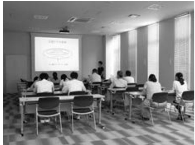
図1 摂食嚥下セミナーの様子

セミナーのテーマは5つあり、「摂食嚥下の仕組み、食支援」、「摂食嚥下の訓練、食支援」、「介護食品・食器具の紹介、食支援」、「口腔ケア」、「口腔乾燥症、味覚障害」である。毎回、この5つのテーマのうち1つについて、当科スタッフが60-90分程度の講義および実習を行っている。最初の「摂食嚥下の仕組み、食支援」では、摂食嚥下の仕組みや食事の姿勢などの食事の環境設定や食後に注意すべき点について講義を行っている。2つ目の「摂食嚥下の訓練、食支援」では、嚥下障害への対応の仕方、食形態や一口量の設定等の食事の留意点について講義を行った後、種々の間接訓練を実習形式で紹介