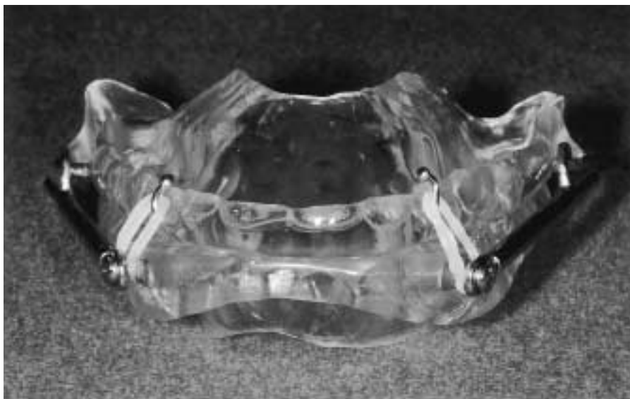
写真：当科で作製している口腔内装具

われわれは、Clarkら 9) によって報告されたツーピース型に分類されるHerbst型装置を改良して使用している(写真)。多数歯欠損、高度歯周病、顎関節疼痛が無いことを確認し、印象採得し、次に咬頭嵌合位から下顎の最大前方位までの距離の約70%の前突位にて咬合採得を行う。透明の加熱重合レジンを用いて作製し、患者の口腔内で調整する。口腔内装具を睡眠時に使用してもらい、治療効果が不十分な場合、延長用のリングを挿入し、顎位をさらに前方位とする。逆に、違和感や顎関節症状が強い場合にはチューブ部分を短くなるよう削合し、顎位が後方位になるよう調節する。