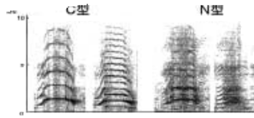
図 - 2

2，3歳児は歯科の診療台に横になっただけでも泣いてしまう場合が多く，口腔内診査にも号泣する患児が見受けられる。周囲の状況に無関係に泣いている幼児の泣き声をサウンドスペクトログラムでみると，図1に示すように患児の呼吸のリズムに一致した泣き声を観察することができる。グラフの横軸（時間軸）に沿った濃淡の濃い部分が呼気層の泣き声，薄い部分が吸気層を表している。薄い部分で観察される周囲の会話によるノイズは，濃い部分で泣き声の波形に大きな影響を与えていないことが分かる。次に，図2に示すような2つの泣き声の型